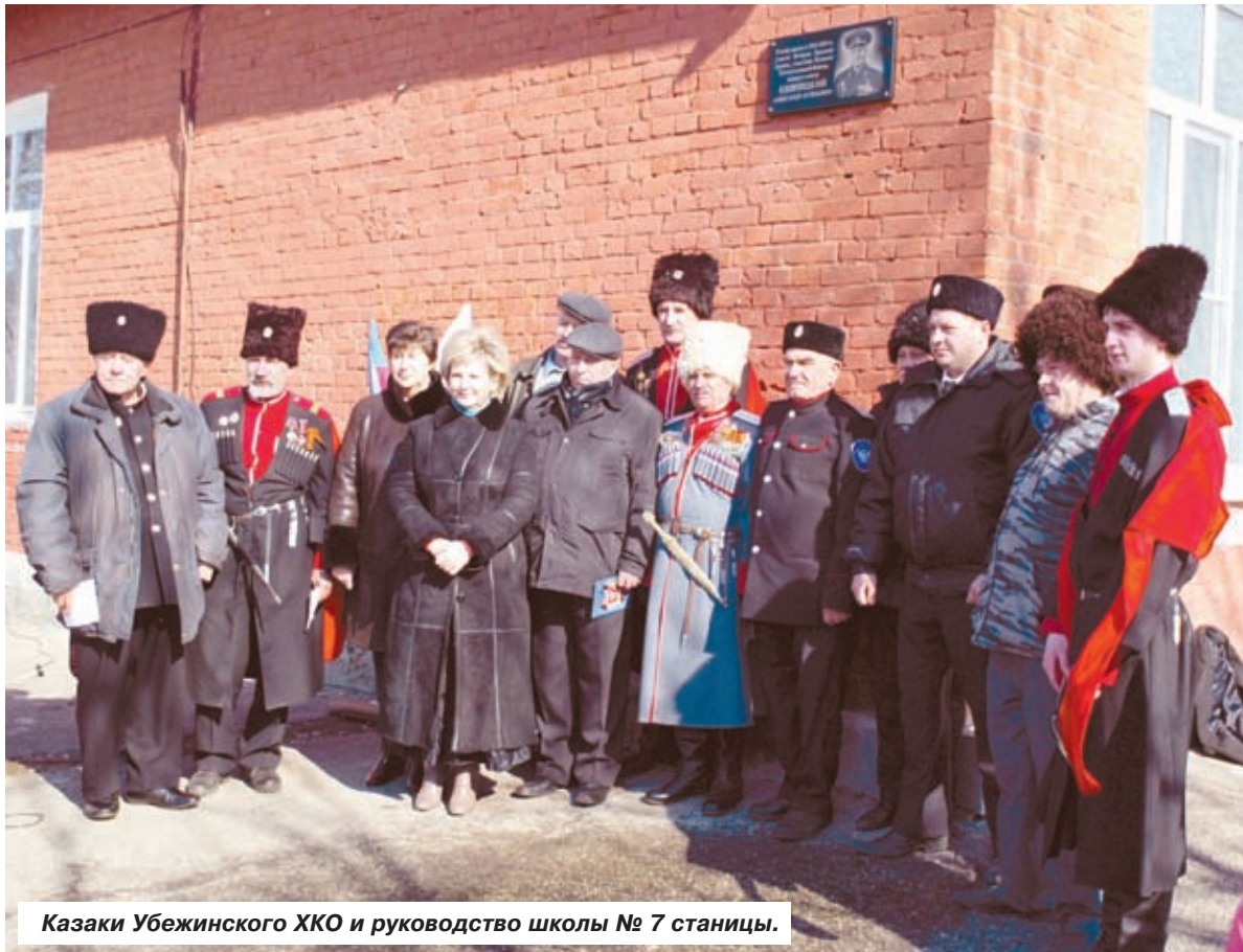
Казаки Убеженского ХКО и руководство школы № 7 станицы.