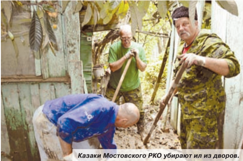
Казаки Мостовского РКО убирают ил из дворов.

Аномальные ливни, обрушившиеся на Кубань и Черноморское побережье, принесли с собой множество бед и разрушений.