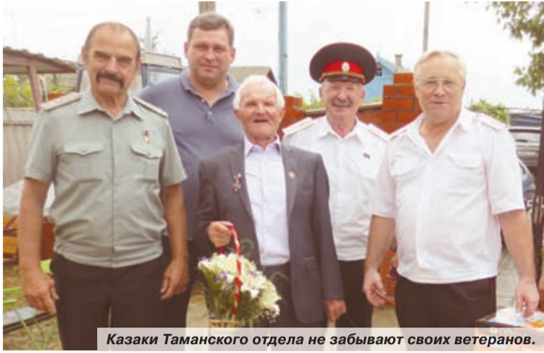
Казачи Таманского отдела не забывают своих ветеранов.