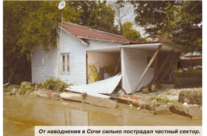
От наводнения в Сочи сильно пострадал частный сектор.