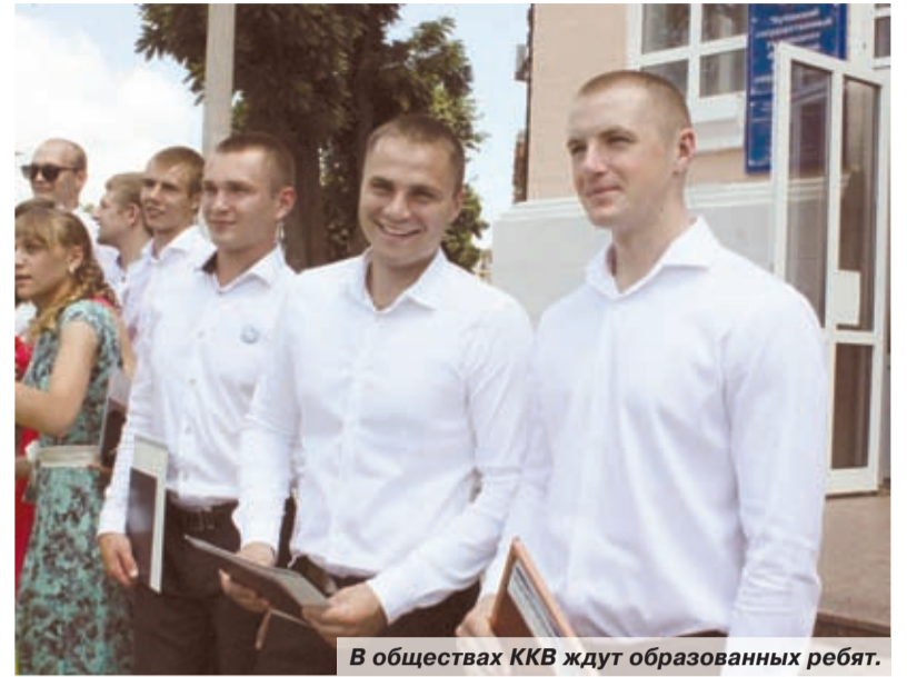
В обществах ККВ ждут образованных ребят.