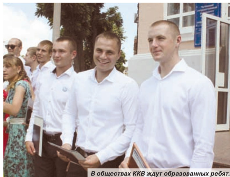
В обществах ККВ ждут образованных ребят.