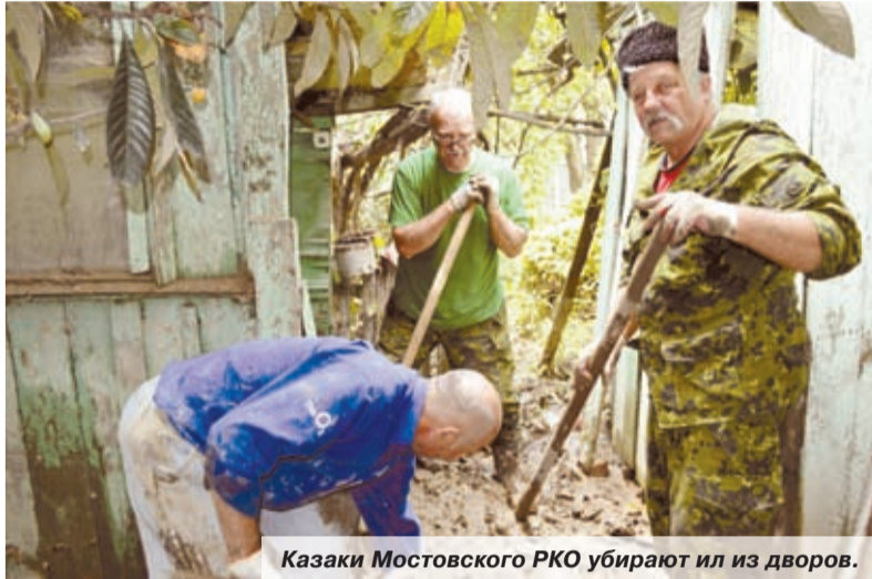
Казаки Мостовского РКО убирают ил из дворов.

Аномальные ливни, обрушившиеся на Кубань и Черноморское побережье, принесли с собой множество бед и разрушений.