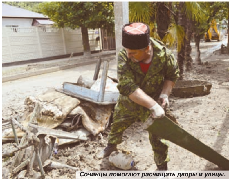
Сочинцы помогают расчищать дворы и улицы.