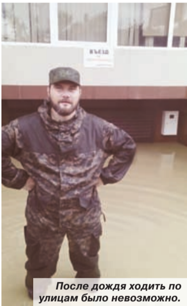
После дождя ходить по улицам было невозможно.