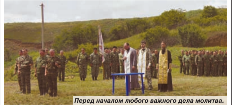
Перед началом любого важного дела молитва.

В станице Кавказской состоялись очередные военно-полевые сборы Лабинского отдела.