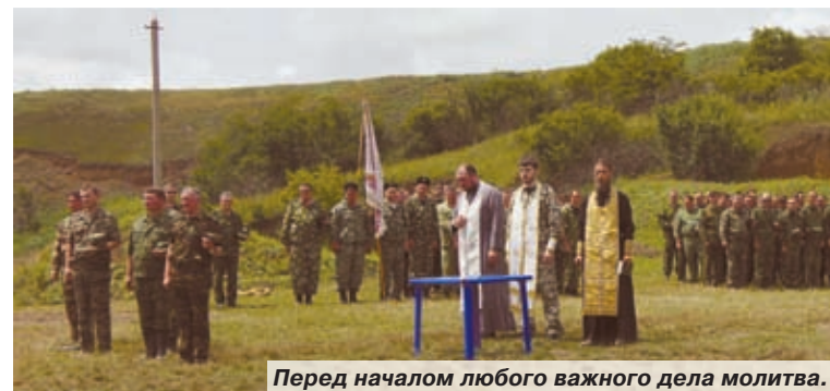
Перед началом любого важного дела молитва.

В станице Кавказской состоялись очередные военно-полевые сборы Лабинского отдела.