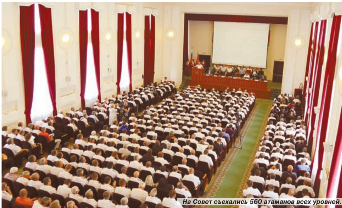
На Совет съехались 560 атаманов всех уровней.