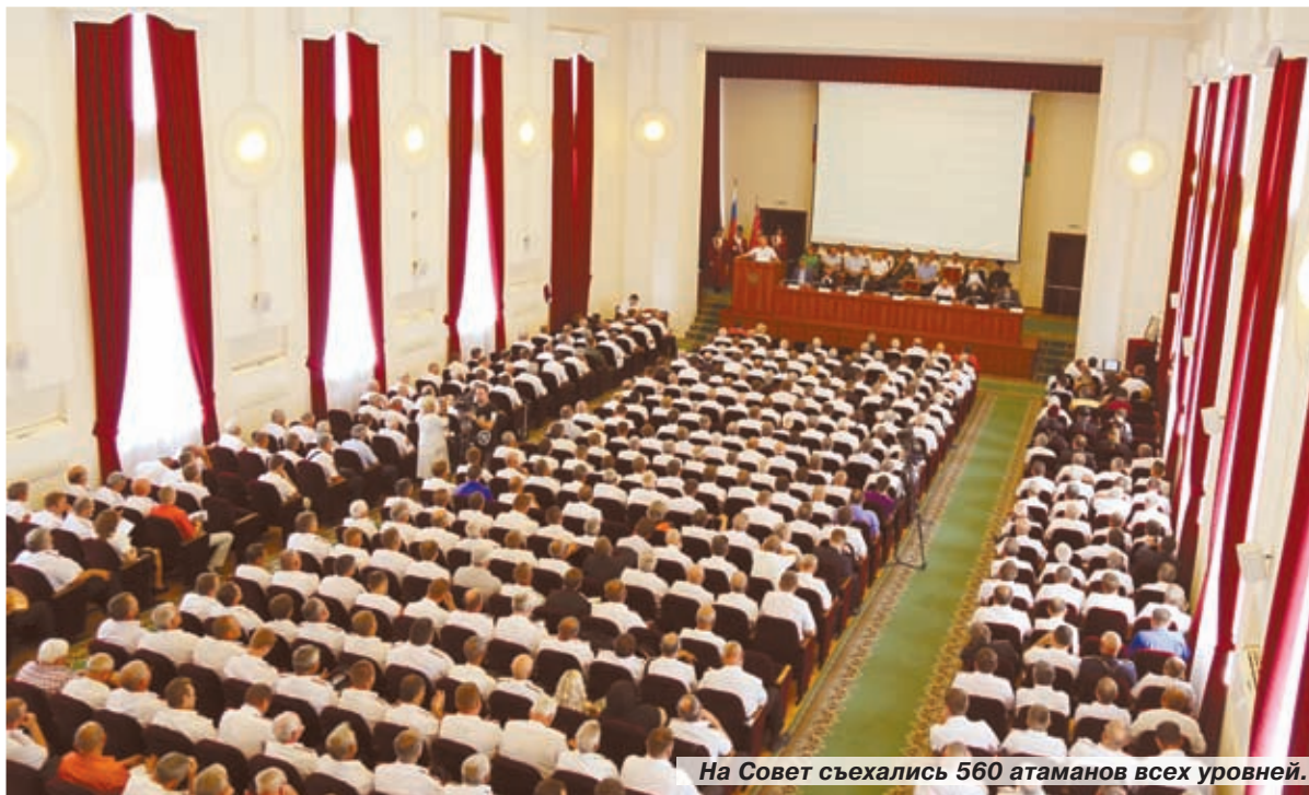
На Совет съехались 560 атаманов всех уровней.