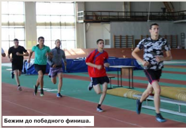
Бежим до победного финиша.