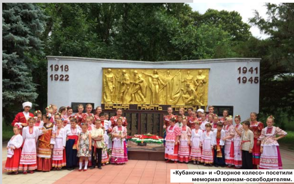
«Кубаночка» и «Озорное колесо» посетили мемориал воинам-освободителям.