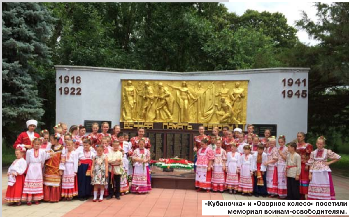
«Кубаночка» и «Озорное колесо» посетили мемориал воинам-освободителям.