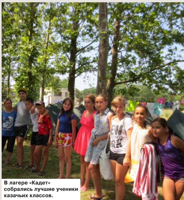
В лагере «Кадет» собрались лучшие ученики казачьих классов.