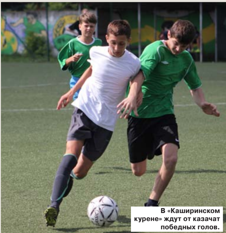
В «Каширинском курене» ждут от казачат победных голов.

В окружном отборочном этапе на Кубок губернатора Краснодарского края по футболу команда ХКО «Каширинский курень» заняла первое место