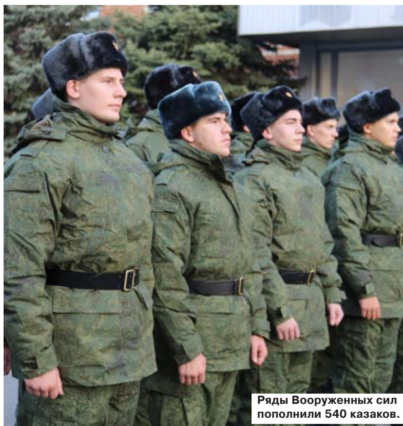
Ряды Вооруженных сил пополнили 540 казаков.