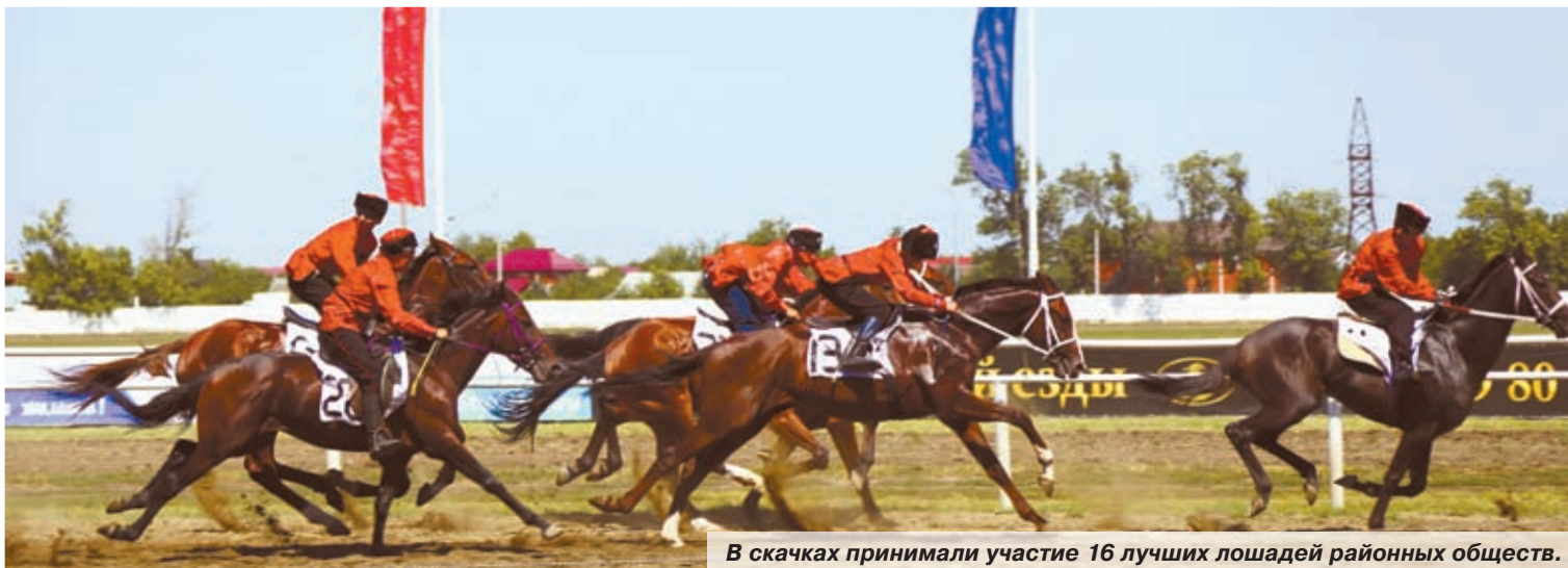
В скачках принимали участие 16 лучших лошадей районных обществ.

Александра ЩЕРБАКОВА.