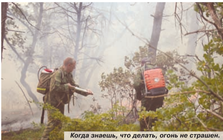
Когда знаешь, что делать, огонь не страшен.

— Желающих помочь казакам в этом непростом деле было хоть