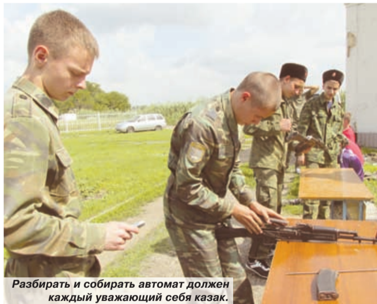
Разбирать и собирать автомат должен каждый уважающий себя казак.

достоинно прошла допризывная казачья молодежь Ейского отдела в оздоровительном центре «Камышинка» Староминского района