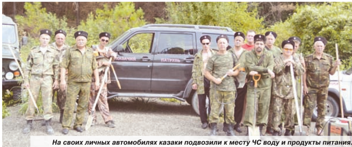
На своих личных автомобилях казаки подвозили к месту ЧС воду и продукты питания.