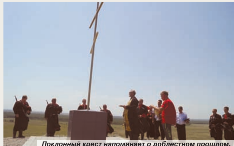
Поклонный крест напоминает о доблестном прошлом.

— С этих самых редутов началась история Кубанского казачьего