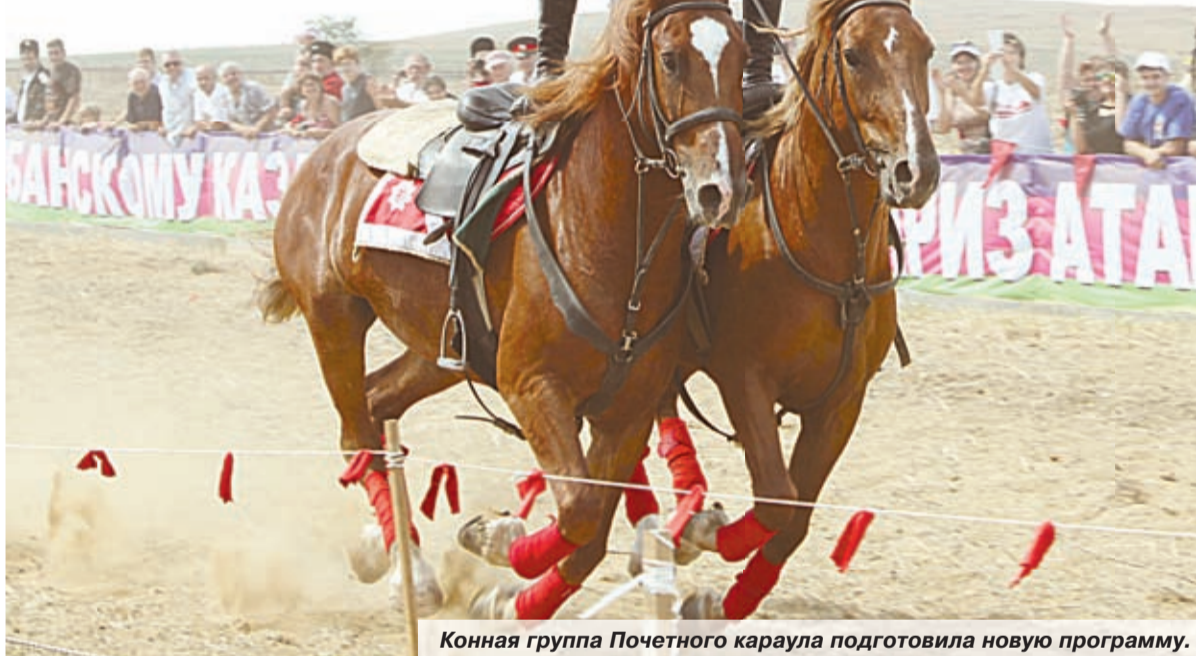
Конная группа Почетного караула подготовила новую программу.

В этом году зрителями одного из самых масштабных праздников Кубанского казачьего войска станут 25 тысяч человек