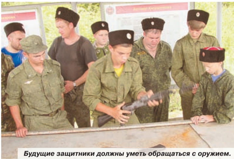
Будущие защитники должны уметь обращаться с оружием.