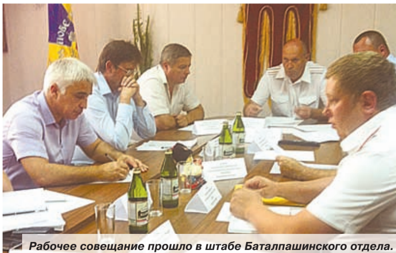
Рабочее совещание прошло в штабе Баталпашинского отдела.

Предположительно, этнографический комплекс будет располагаться на въезде в Урупский район