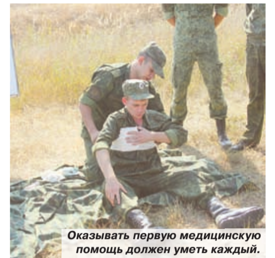
Оказывать первую медицинскую помощь должен уметь каждый.