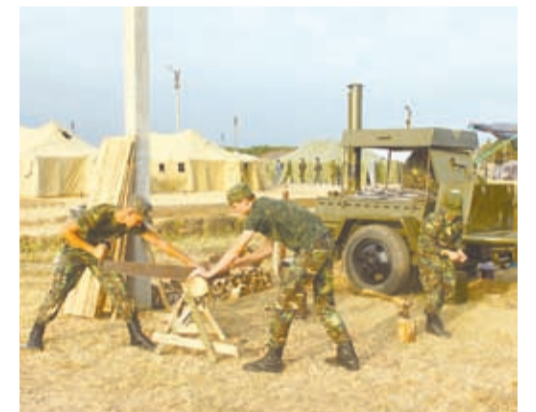
О полевой кухне заботились сами казаки.