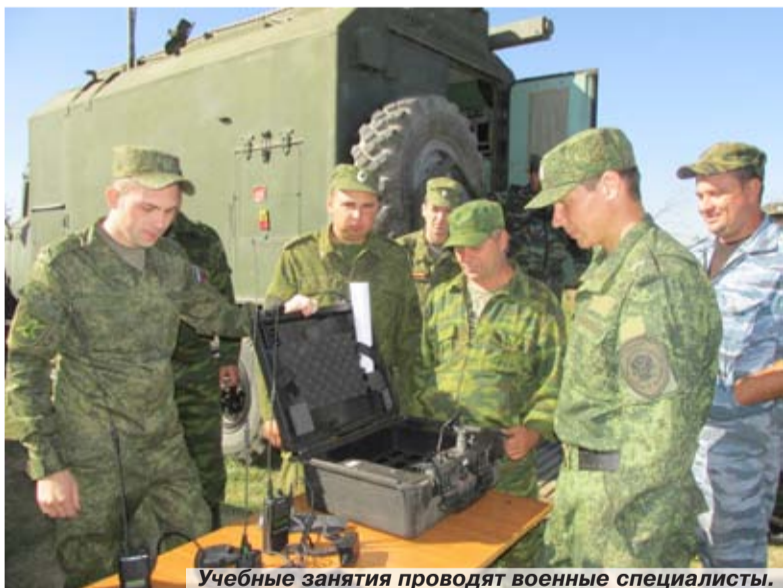
Учебные занятия проводят военные специалисты.

В Ейском районе прошли трехсуточные военно-полевые сборы 1-го Запорожского Императрицы Екатерины Великой и 1-го Уманского Бригадира Головатого полков Ейского отдела.