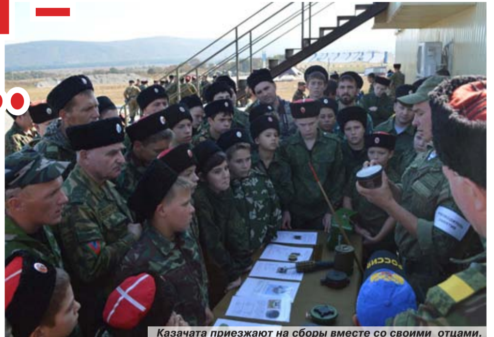
Казачата приезжают на сборы вместе со своими отцами.

Посетил мероприятие одного из лучших отделов ККВ губернатор Краснодарского края Вениамин Кондратьев. Побывать на военно-полевых сборах Таманского отдела Вениамин Иванович пообещал войсковому атаману несколько месяцев назад. О том, что казаки серьезно подходят к подготовке к военному делу, губернатор слышал, но увидел в первый раз и был приятно удивлен.