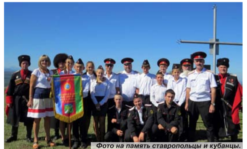
Фото на память ставропольцы и кубанцы.