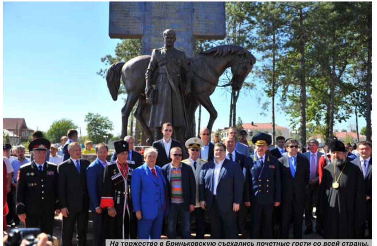
На торжество в Бриньковскую съехались почетные гости со всей страны.