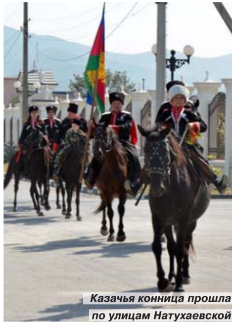
Казачья конница прошла по улицам Натухаевской

Станица Натухаевская города Новороссийска отметила 72-ю годовщину освобождения от немецко-фашистских захватчиков.