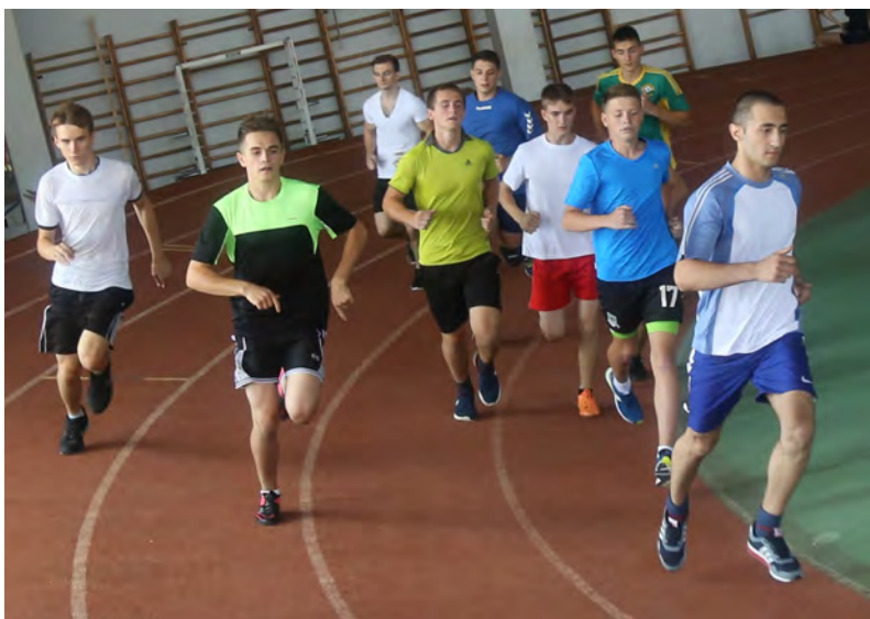
К испытаниям абитуриенты всегда готовы.

Челночный бег, шестидесятиметровка, прыжки в длину, подтягивание, а также дистанция длиной в километр – такие спортивные испытания ожидали абитуриентов. В этом году факультет физической культуры штурмуют 45 казаков и казачек.