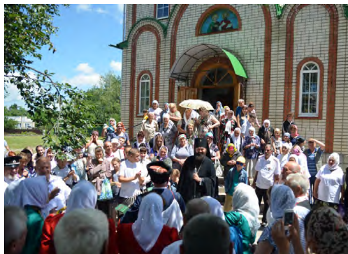
После молебна в Петропавловском храме.

В станице Зеленчукской Карачаево-Черкесии отметили престольный День храма Петра и Павла