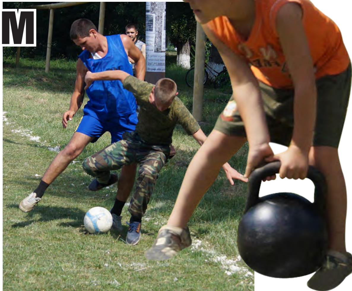
Мальчишки стремятся быть ловкими и сильными.

– Раньше футбольные баталии в станице проходили гораздо чаще, – говорит Александр, – теперь времена меняются, у всех свои проблемы и дела, молодежь перестала собирать-