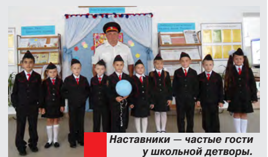
Наставники – частые гости у школьной детворы.