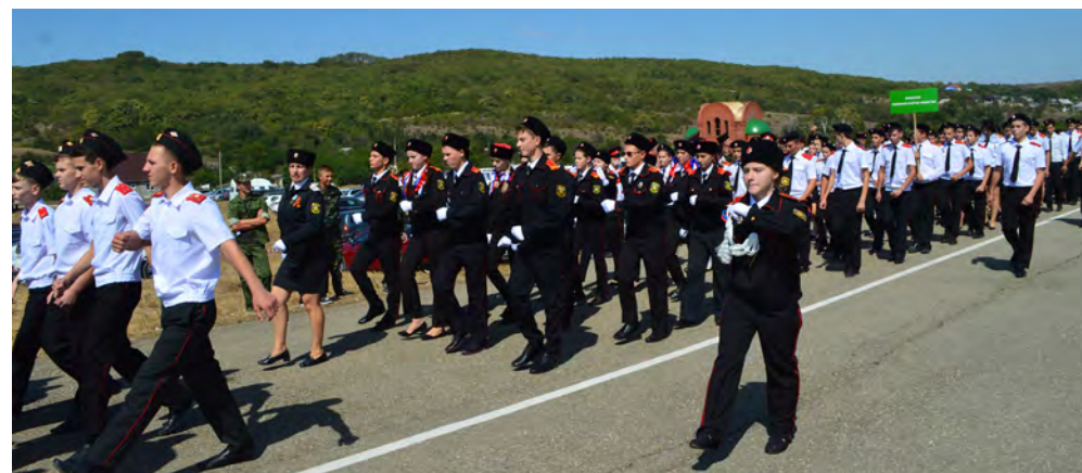
Торжественное прохождение учеников казачьих классов и кадетских корпусов Таманского отдела.

Карина ЖИТЕНЕВА, Елена ШЕБАЛИНА Фото авторов