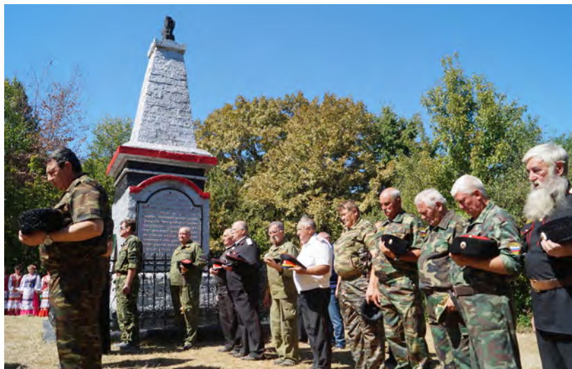
Ежегодно на место битвы приезжают казаки Черноморского округа.