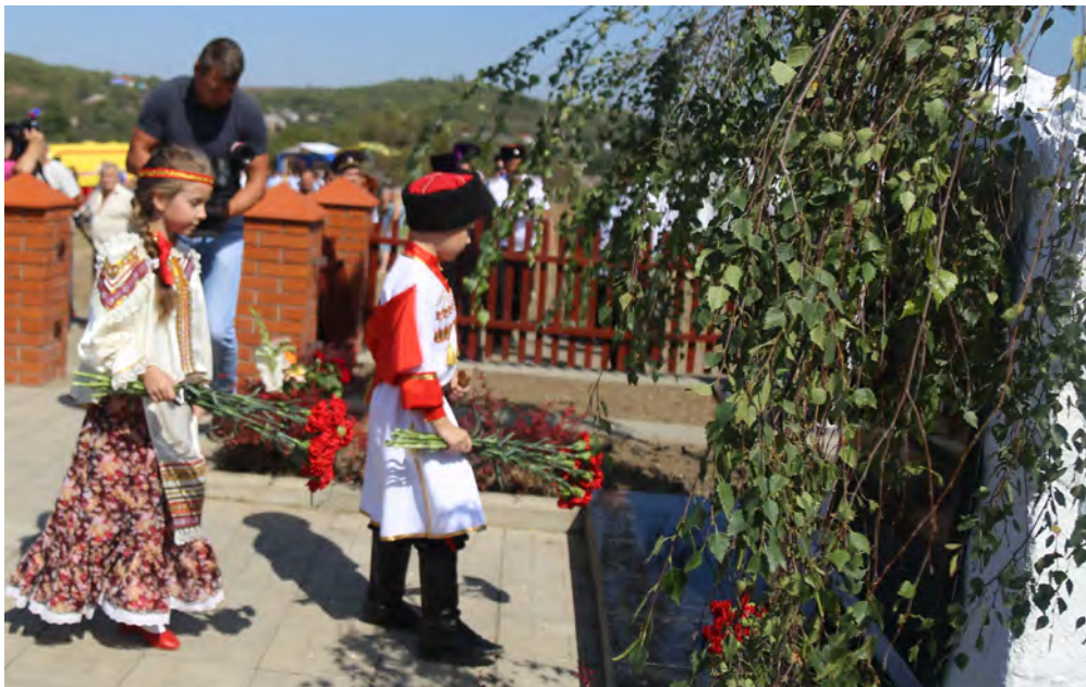
Казачата возложили цветы к памятнику погибшим воинам.

– Сегодня мы должны жить и работать так, чтобы потомки могли нами гордиться. И