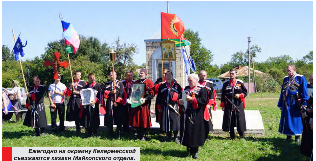
Ежегодно на окраину Келермесской съезжаются казаки Майкопского отдела.