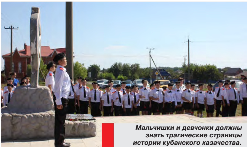
Мальчишки и девчонки должны знать трагические страницы истории кубанского казачества.