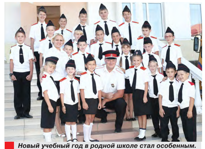
Новый учебный год в родной школе стал особенным.

– Наша мечта – построить новый корпус с полноценным спортивным залом, – продолжает директор, – а уже существующий – переделать в актовзый зал, где дети смогут активнее заниматься школьной самодеятельностью.