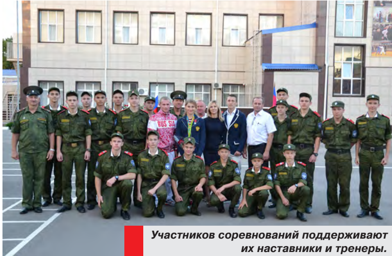
Участников соревнований поддерживают их наставники и тренеры.