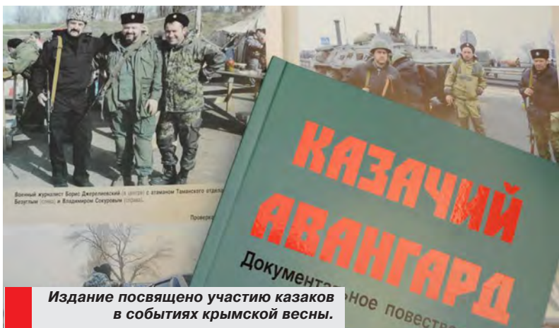
Издание посвящено участию казаков в событиях крымской весны.

Книга о вкладе казачества Кубани в воссоединение России с Крымом победила во всероссийском конкурсе