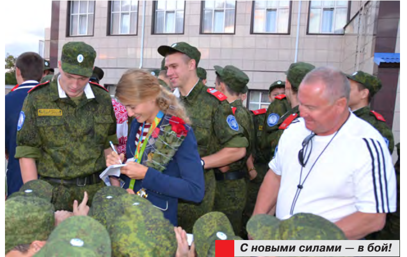
С новыми силами — в бой!