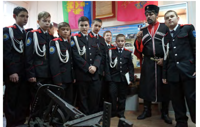
■ Казачата Новороссийского кадетского корпуса с удовольствием разглядывали оружие времен Гражданской.

В историко-краеведческом музее Геленджика открылась экспозиция «Кубанские казаки — сыны воли и славы»