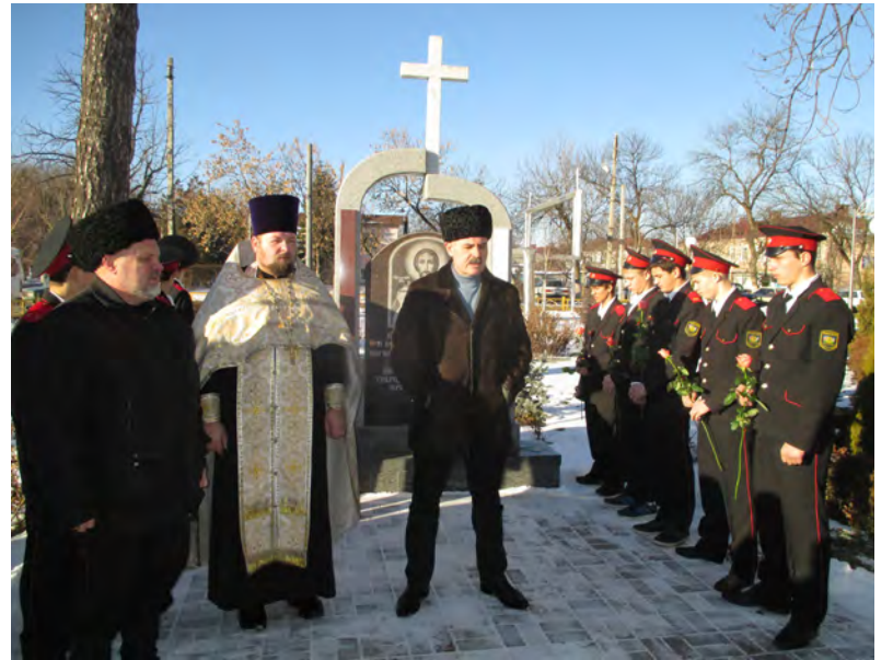
■ В городе Лабинске состоялась памятная панихида.