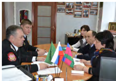
■ Организаторы фестиваля обсуждают оргвопросы.

В Майкопском казачьем отделе готовятся к ежегодному Межрегиональному фестивалю казачьей культуры в поселке Тульском