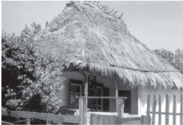
Типичное жилище казака.

Войсковое правительство понимало его опасность. В марте следующего года была составлена ведомость распределения мест поселения казачьих куреней. Потребовалось немало усилий, чтобы собрать казаков в их селения.