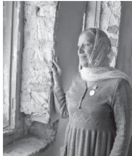
Благотворительница Варвара верит в возрождение храма.

Копия литографии пустыни висит в Свято-Димитровском храме, открытом на втором этаже бывшей монастырской трапезной. Это единственная в районе церковь, расположенная на втором этаже. Прихожане поднимаются туда по лестнице со старинными коваными перилами. Почти все бабушки при этом вздыхают: идти тяжело, все-таки возраст. Знают эти перила и прикосновения молодых рук. Вот и сейчас под лестницей лежит чей-то подростковый велосипед.