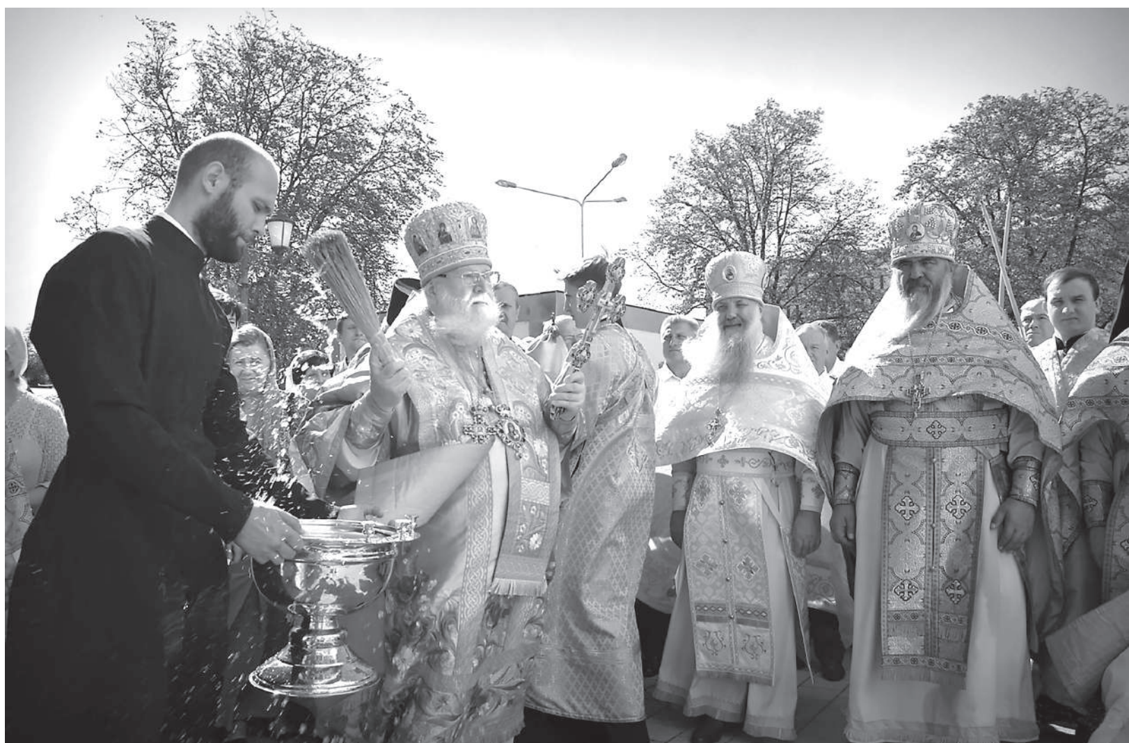
■ Митрополит Екатеринодарский и Кубанский всегда относился с уважением к своим духовным братьям – от рядового духовенства до высокого сана.

На этой неделе Кубань простилась с главой Кубанской митрополии митрополитом Исидором. Так случилось, что время его служения совпало с возрождением казачества, которое он принял всей душой и сердцем. Именно в казачестве Владыка увидел ту силу, которая способна нести ответственность не только перед государством и обществом, но и перед Богом. Он не раз говорил, что именно казаки не стесняются говорить о своих потерях и необходимости восстанавливать все, что было утрачено в годы лихолетья. Считал, что казачеству необходима духовная опора. Поэтому благодаря ему у Кубанского казачьего войска появился свой войсковой священник, как и у каждого отдела, каждого общества, как это было до революции. Наверное, не хватит газетной полосы, чтобы рассказать о том, сколько он сделал для казаков Кубани. Уход Владыки для каждого стал невосполнимой потерей.