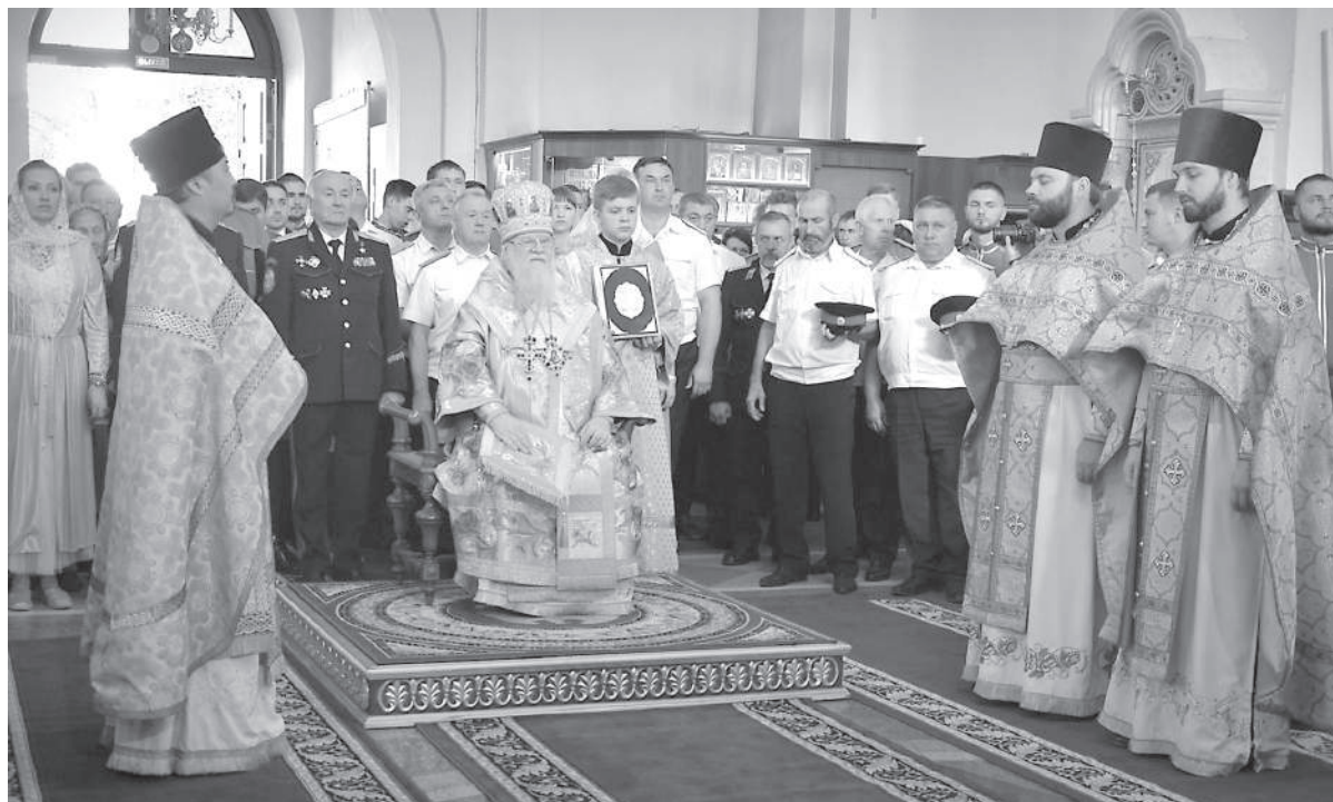
■ Казаки почитали Владыку как своего духовного отца. Его благословение хотел получить каждый, и он никогда никому не отказывал.

Именно по благословению Владыки церковь неустанно заботится о казаках. Кубанское казачество кознет, собирает по крупичкам не только воинские регалии, культуру, обычаи, но, в первую очередь, обретает веру. Каждый