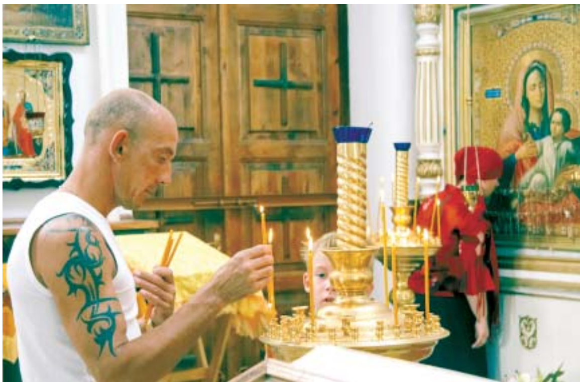
Храм — приют для каждого.