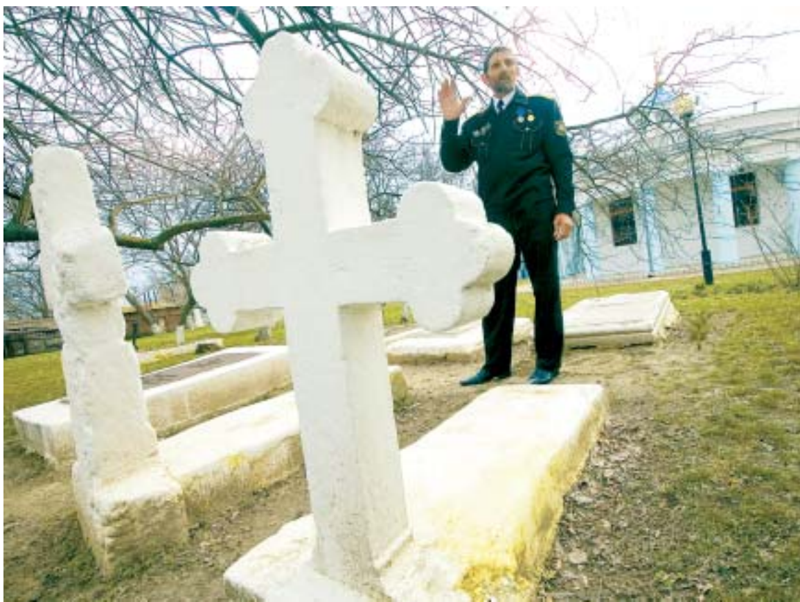
Храм могли разрушить в 30-е годы, но за него заступились археологи и краеведы.