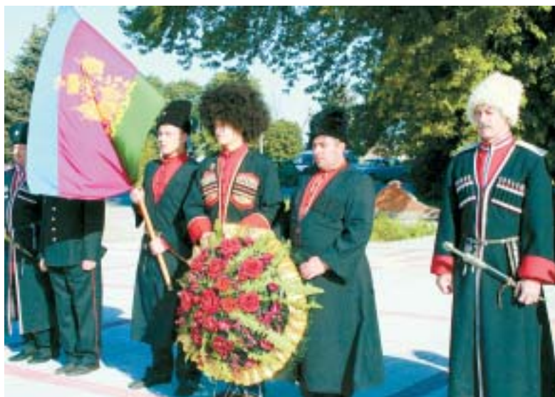
Этим летом к братской могиле предков-казаков у деревни Федюково возложили венки казаки Васюринского станичного общества — члены автомотоклуба «Кубань» и активисты общества «Хранители наследия». Они побывали там в рамках экспедиции «Кубань — Курская дуга — Москва-2008».